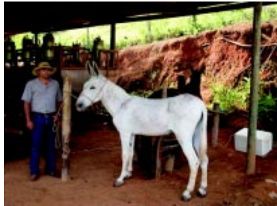
FIGURA 2 - Jumento Pêga adulto contido por um auxiliar durante avaliação do comportamento sexual