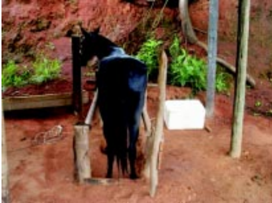
FIGURA 1 - Égua da raça Campolina em estro, contida em tronco, e utilizada como manequim para coleta de sêmen de jumentos.

Foram efetuados cálculos da média aritmética e desvio padrão para cada variável utilizada na avaliação da efetividade da metodologia.