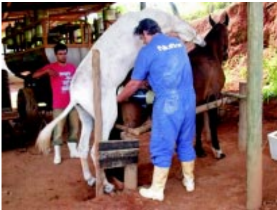
FIGURA 3 - Coleta de sêmen de jumento Pêga adulto, utilizando égua da raça Campolina como manequim.